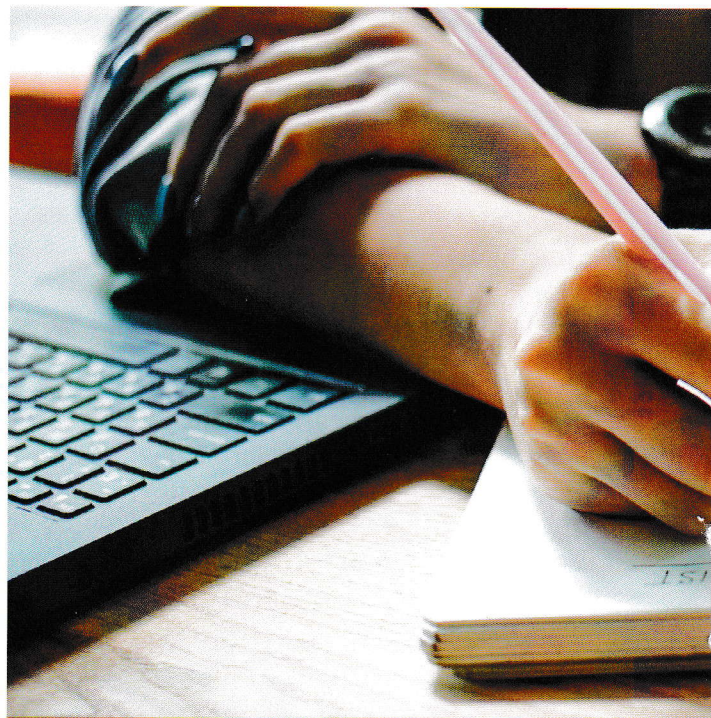
SICH IM KOLLEGIUM AUF GRUNDSÄTZLICHE ASPEKTE VERSTÄNDIGEN

5 Leistungsbewertung bei Kindern mit Migrationshintergrund