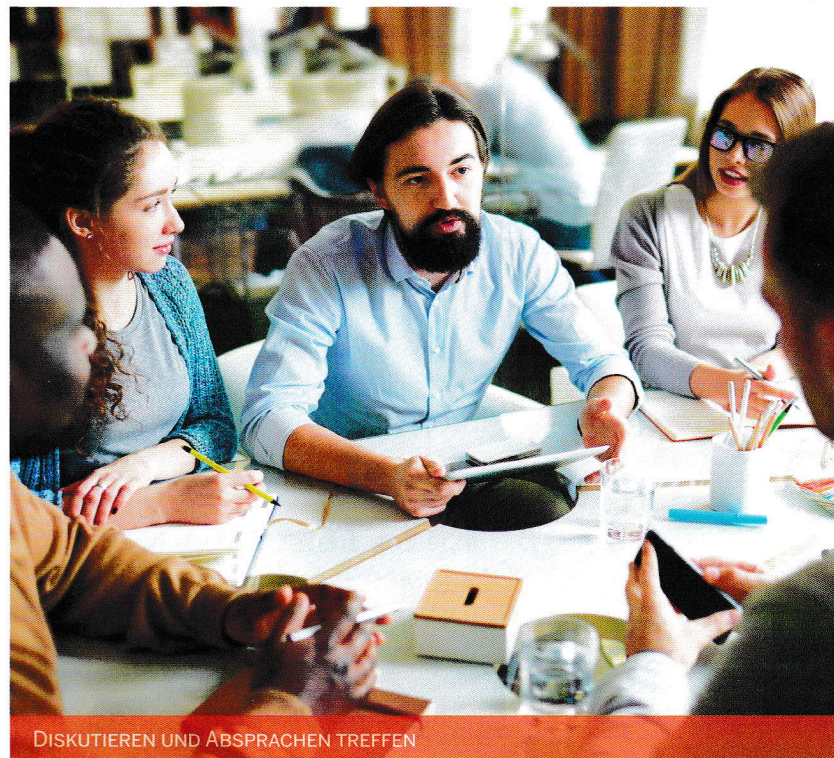
DISKUTIEREN UND ABSPRACHEN TREFFEN

dungsordnung Grundschule (AO-GS) und die Richtlinien und Lehrpläne berücksichtigt werden. Im Folgenden werden die wesentlichen Aspekte kurz erläutert.