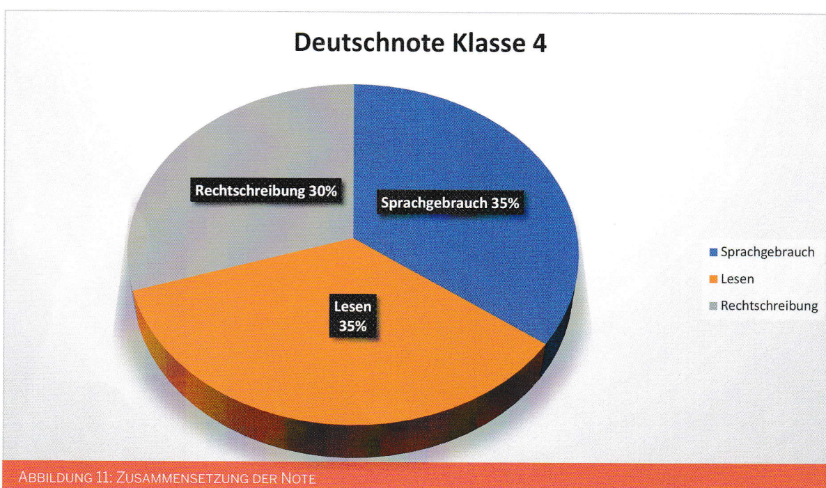
ABBILDUNG 11: ZUSAMMENSETZUNG DER NOTE

Die hier aufgeführten Möglichkeiten des Nachteilsausgleichs bei zielgleichem Unterricht werden nach pädagogischem Ermessen und in Absprache mit der Klassenkonferenz und dem Elternhaus eingesetzt und regelmäßig evaluiert. Im Förderplan wird individuell festgelegt, welche Formen