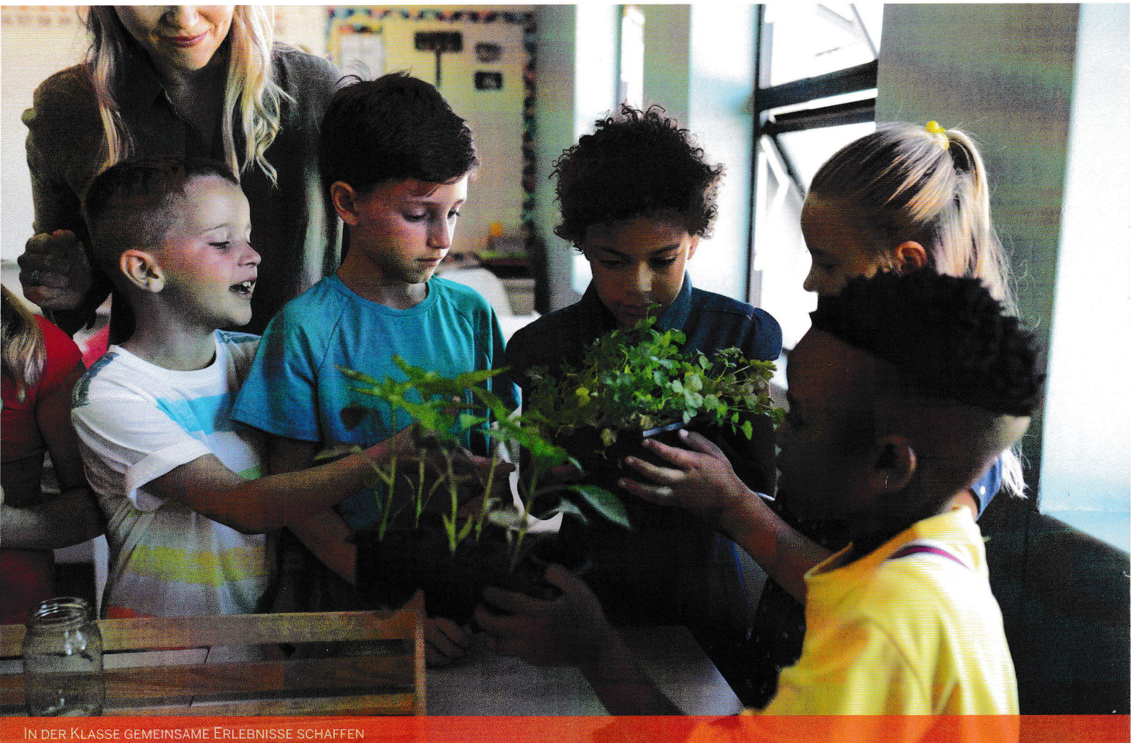
IN DER KLASSE GEMEINSAME ERLEBNISSE SCHAFFEN

Solange noch Sprachschwierigkeiten bestehen, werden die individuellen Lernfortschritte besonders gewichtet. Die Aufgabenstellungen sollen die individuellen Lernvoraussetzungen vor allem im sprachlichen Bereich berücksichtigen.